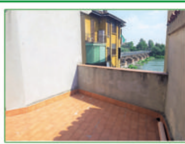
TRILOCALE vista Fiume Adda, comodo per il centro. Classe G. Euro 80.000,00