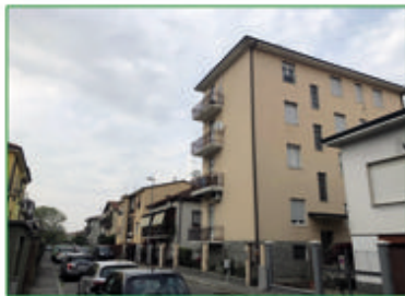
BILOCALE Lodi vicinanze stazione, libero subito. Classe G. Euro 39.000,00