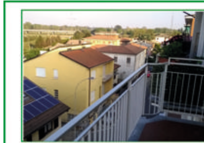
TRILOCALE CON POSTO AUTO comodo per ospedale e centro storico, termoautonomo. Classe E. Euro 90.000,00