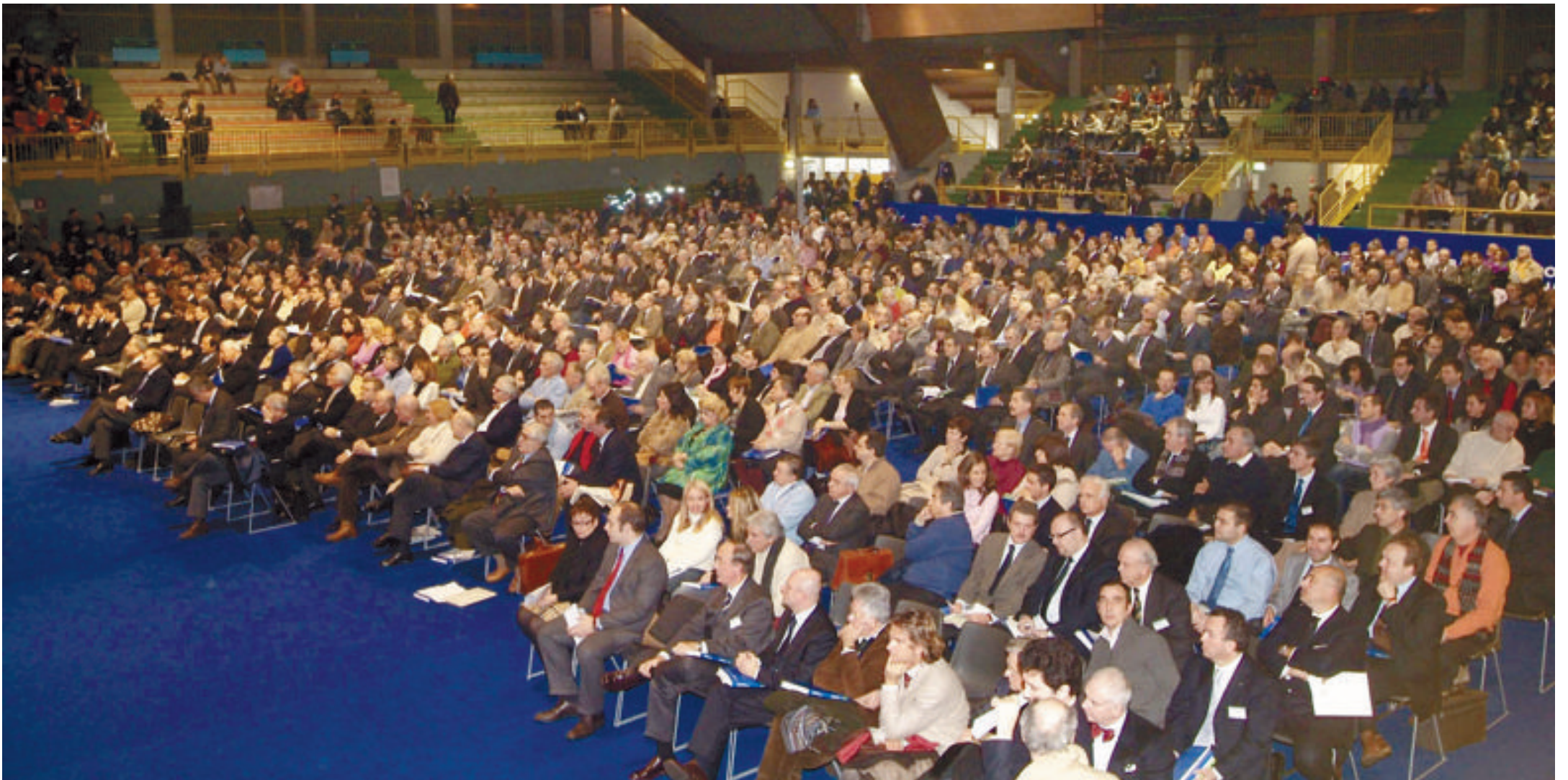
Poco meno di duemila soci sui seimila che si erano iscritti hanno partecipato ieri al "PalaCastellotti" a Lodi all'assemblea ordinaria della Banca Popolare Italiana, chiamata a votare il primo consiglio di amministrazione del dopo Fiorani A CAUSA DELLA NEVE AFFLUENZA INFERIORE ALLE ATTESE, BENEVENTO SCARICA LE COLPE SU FIORANI, GIARDA SARÀ IL NUOVO PRESIDENTE